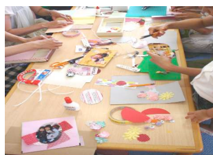
←スクラップブック 制作風景

また、7月8日(木)は、福岡おはなしの会による「わらべうたであそぼう」のミニ講座をしました。0歳と1歳の子が多く、お母さんのやさしい歌声やリズム感のある絵本に、心地よい刺激を受けているようでした。